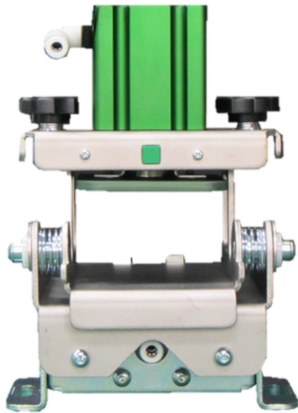
■ ノーマルクランプ (オプション) 従来型と同製品。