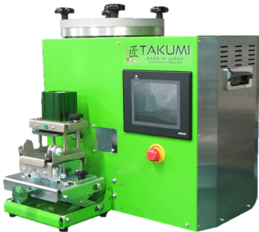
TAKUMI + Clamp